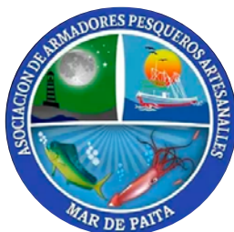
Comité Nacional Sistema del Producto Calamar